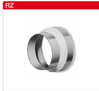
Reduzierungen aus verzinktem Stahlblech bzw. Kunststoff*.