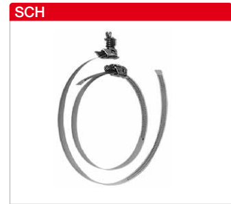
Schlauchschellen Metallband mit Spannschloss. Lieferung als Packungseinheit mit jeweils 10 Stück.