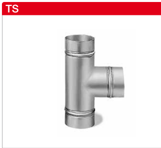
T-Stücke aus Stahlblech, verzinkt.