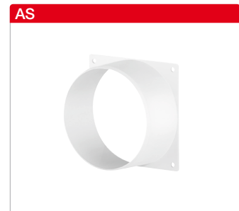
Anschluss-Stutzen AS Mit quadratischer Flanschplatte (102 x 102 mm) und rundem Stutzen (50 mm lang), aus Kunststoff. Zum Aufsetzen von Rohren (ND 100) auf plane Flächen.