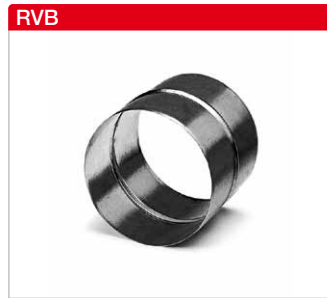
Rohrverbinder aus Stahlblech, verzinkt.